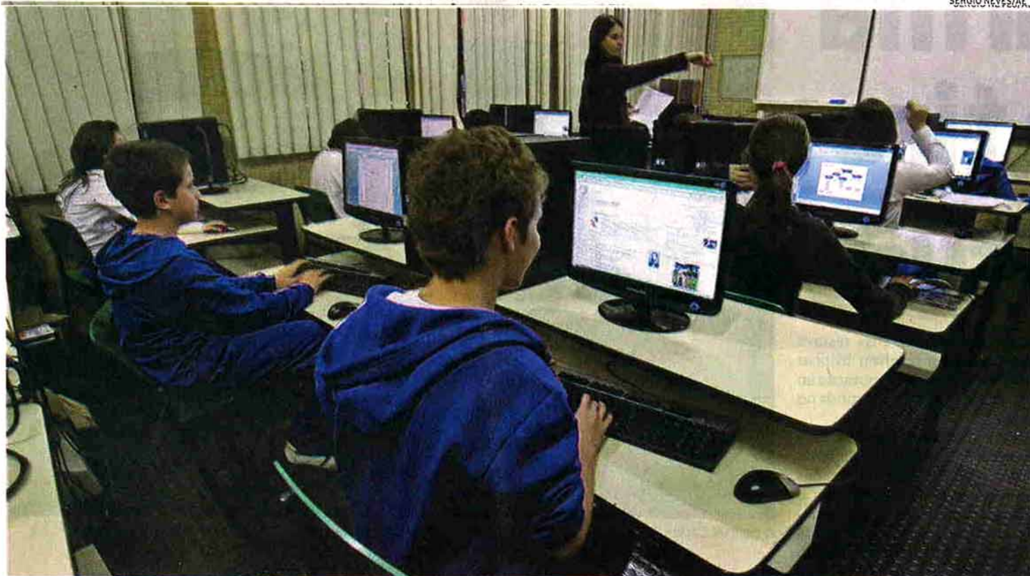
Aula de Informática da turma do 8º ano do Colégio Santo Américo: internet é liberada, mas há controle para que alunos só visitem sites inofensivos

"A minha mãe só deixou fazer o Facebook há um mês. Antes não tinha nada. Se tenho que comprar alguma coisa, peço e depois ela de-